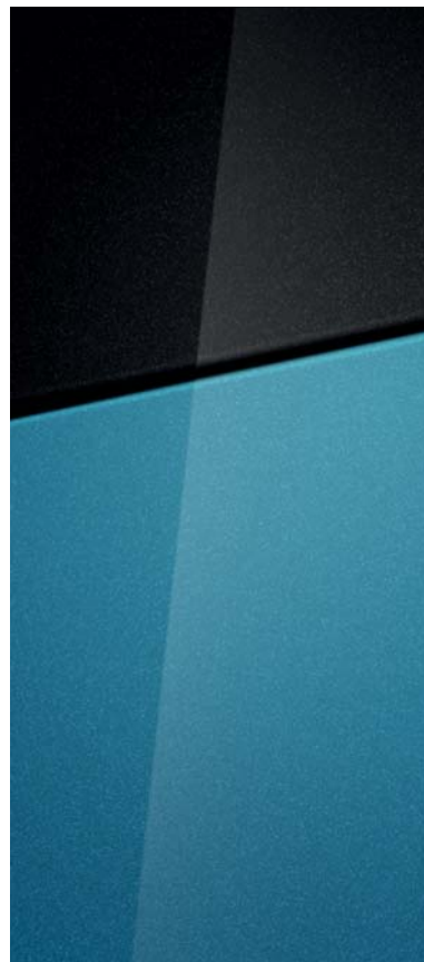
Aqua Turquoise Metallic

Na přání střecha v barvě Phantom Black Pearl.