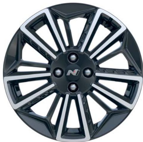
17" disk z lehké slitiny

Sportovně laděný podvozek i20 N Line harmonicky doplňují specifické 17" disky kol z lehké slitiny s dvoubarevnou povrchovou úpravou, které dotvářejí dynamický profil vozu.