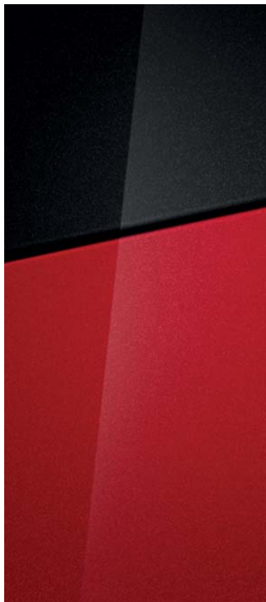
Dragon Red Pearl

Na přání střecha v barvě Phantom Black Pearl.