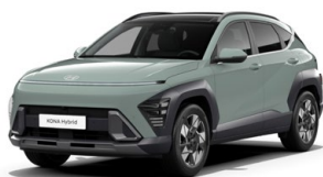
Mirage Green Pastelová Kombinace dostupná také s černým lakováním střechy Cena: 0 Kč