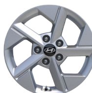
16" kola z lehké slitiny