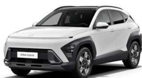
Atlas White Pastelová Kombinace dostupná také s černým lakováním střechy Cena: 9 900 Kč