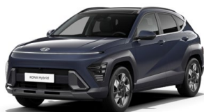
Denim Blue Pearl Perleťová Kombinace dostupná také s černým lakováním střechy Cena: 17 900 Kč