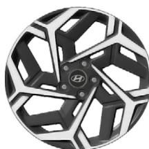
Unikátní N Line 18" kola z lehké slitiny

www.porovnejhyundai.cz (Porovnejte si vozy Hyundai s konkurencí)