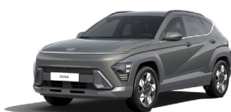
Amazon Gray Metalická Kombinace dostupná také s černým lakováním střechy Cena: 17 900 Kč