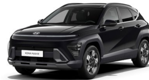
Abyss Black Pearl Perleťová Cena: 17 900 Kč