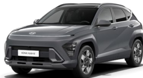
Ecotronic Gray Pearl Perleťová Kombinace dostupná také s černým lakováním střechy Cena: 17 900 Kč