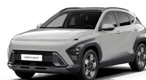
Cyber Gray Metallic Metalická Kombinace dostupná také s černým lakováním střechy Cena: 17 900 Kč