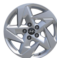
17" kola z lehké slitiny