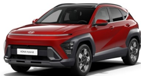
Ultimate Red Metallic Metalická Kombinace dostupná také s černým lakováním střechy Cena: 17 900 Kč