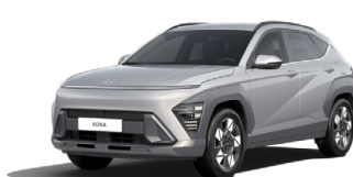
Shimmering Silver Metallic Metalická Kombinace dostupná také s černým lakováním střechy Cena: 17 900 Kč