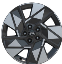
18" kola z lehké slitiny