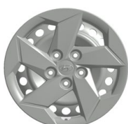
16" ocelová kola s celoplošnými kryty