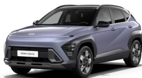
Meta Blue Pearl Perleťová Kombinace dostupná také s černým lakováním střechy Cena: 17 900 Kč