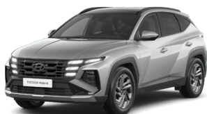
Shimmering Silver Metallic Metalická Cena: 0 Kč