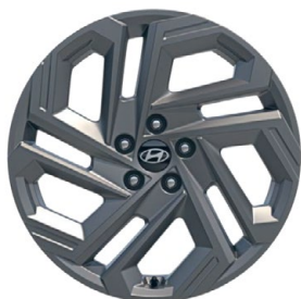
19" kola z lehké slitiny

www.porovnejhyundai.cz (Porovnejte si vozy Hyundai s konkurencí)