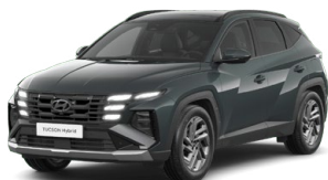
Cypress Green Pearl Perleťová Cena: 0 Kč