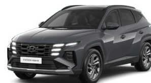
Ecotronic Gray Pearl Perleťová Cena: 0 Kč