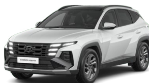
Serenity White Pearl Perleťová Cena: 0 Kč