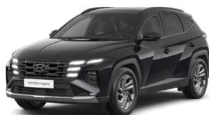
Abyss Black Pearl Perleťová Cena: 0 Kč