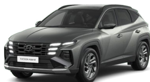
Pine Green Matt Matná Cena: 15 000 Kč